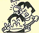
【一般入試 不合格者の多かった学校】 男女計